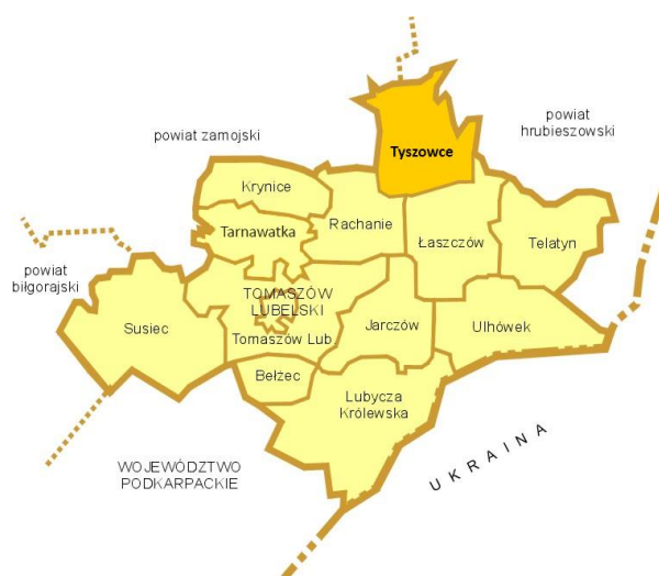
Rys. 2 Gmina Tyszowce na tle powiatu tomaszowskiego

O wielokulturowym dziedzictwie tych ziem świadczą liczne zabytki świeckie i sakralne, jak np. grodziska wczesnośredniowieczne należące do Grodów Czerwieńskich, kościoły rzymskokatolickie, cerkwie greckokatolickie (unickie) i prawosławne, zbory ewangelickie i żydowskie synagogi.